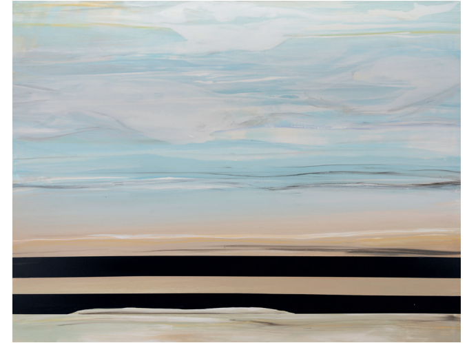
▲ Eva Maria Enders | Makuladystopie | 2022 | VG Bild-Kunst, Bonn 2025

Gezeigt werden folgende 14 Künstlerinnen und Künstler, deren Werke entweder durch Ankäufe, Schenkungen oder als Leihgaben Teil der Städtischen Kunst-