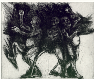
Titus Lerner | Zyklus | 1983 | Courtesy the Artist | Foto: MRM

▼ Titus Lerner | Zyklus | 1983 | Courtesy the Artist | Foto: MRM