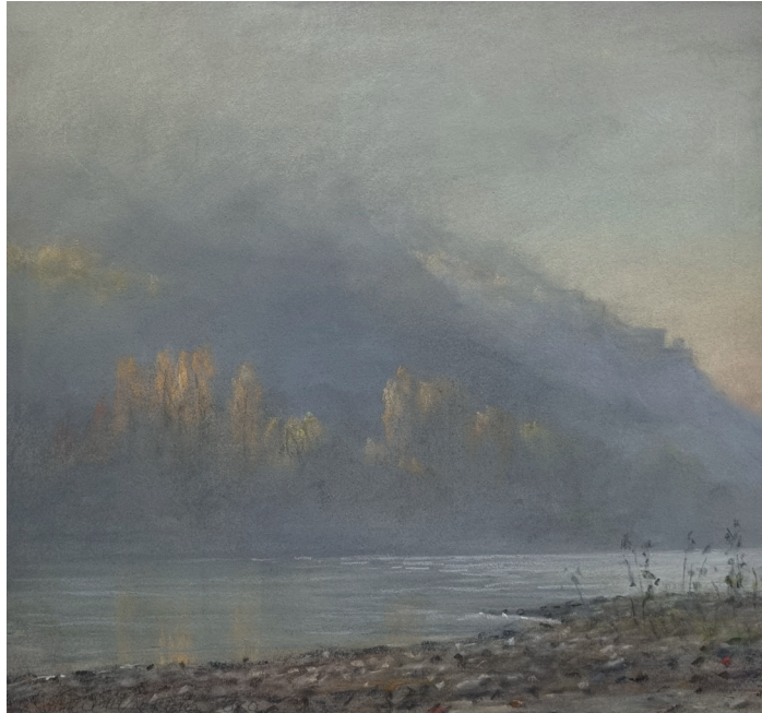
▲ Andreas Bruchhäuser | Rhein bei Koblenz | 2010 | VG Bild-Kunst, Bonn 2025 | Foto: MRM

Exemplarisch hierfür steht das Titelbild Koblenzer Tuch von Susanne Krell, das die bewegte Geschichte unserer Sammlung zeigt. Es entstand im Jahr 2008, als die Baugrube für das neue Museum am Zentralplatz ausgehoben wurde. Aus diesem Anlass suchte die Künstlerin die zehn verschiedenen Orte auf, die die Städtische Kunstsammlung im Laufe ihres Bestehens beherbergt hatten.